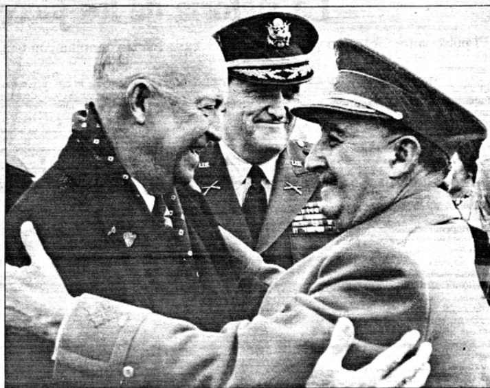
Franco, con el presidente norteamericano Eisenhower, en 1959.

La tradicional cooperación con los norteamericanos iniciada por Franco a finales de los años 50 con el tratado de bases militares Yankees en España, se mantendría ininterrumpidamente en cualquier cosa que se les ofreciera a los norteamericanos, aunque no pertenecieramos a la OTAN. La colaboración en la red