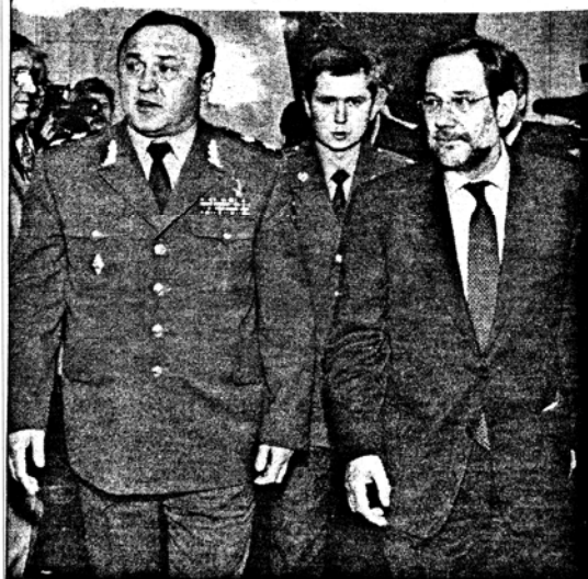
Javier Solana, acompañado por el ministro de Defensa ruso, Pavel Grachov.