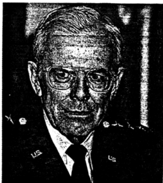
Responsable. El general John Galvin, mando de las fuerzas aliadas de Europa, coordinaba «Gladio»

pais para el abastecimiento de los aviones USA en el bombardeo de la Libia de Gadafi y en la guerra del Golfo..... El PSOE recibiría como premio el nombramiento de Secretario General de la OTAN (1996) en la figura de uno de sus prohombres Javier Solana. Tras ser preguntado en cierta ocasión Solana sobre como se explicaba en un socialista tal cambio de mentalidad, tras mantener en un principio lo de "OTAN de entrada no" a acceder al máximo cargo de la Alianza, contestó que en su juventud había estado equivocado.